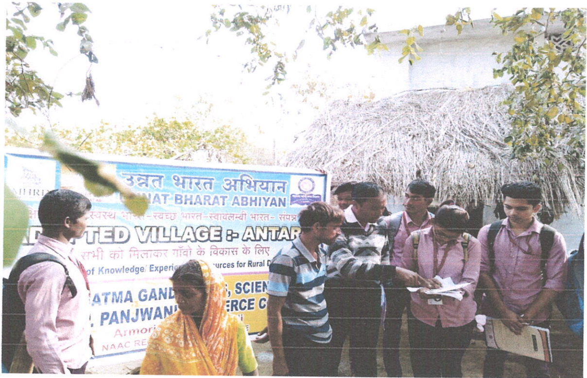
Baseline Survey and data collection at adopted villages