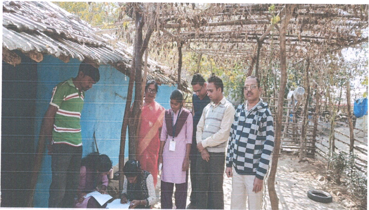
Baseline Survey under Unnat Bharat Abhiyan (UBA)